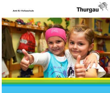
Elternbildung macht Schule Schule macht Elternbildung

Die TAGEO berät neu Schulen im Kanton Thurgau hinsichtlich der Durchführung von Elternbildungsangeboten und vermittelt qualifizierte Referentinnen und Referenten. Sie hat eine Broschüre für Schulleiter, Behördenmitglieder und Lehrpersonen verfasst, die darüber orientiert, warum sich Elternbildung lohnt, und Anhaltspunkte zur Planung und Durchführung von Elternbildungsanlässen gibt.