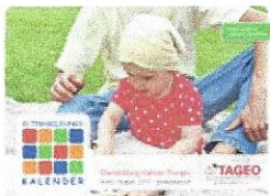
Eltern-Bildung-Kalender TAGEO ...»

Direkt bestellen kann man die Broschüre über die E-Mail-Adresse ebvk@tageo.ch . Die aktuellsten Informationen zu den einzelnen Veranstaltungen findet man zudem jederzeit auf der neu gestalteten Internetseite der TAGEO www.tageo.ch .