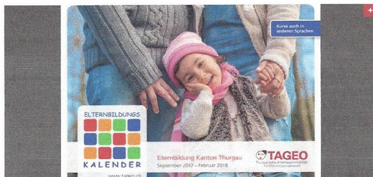
Die 24. Ausgabe des Veranstaltungskalenders «Elternbildung Kanton Thurgau». z.V.g.